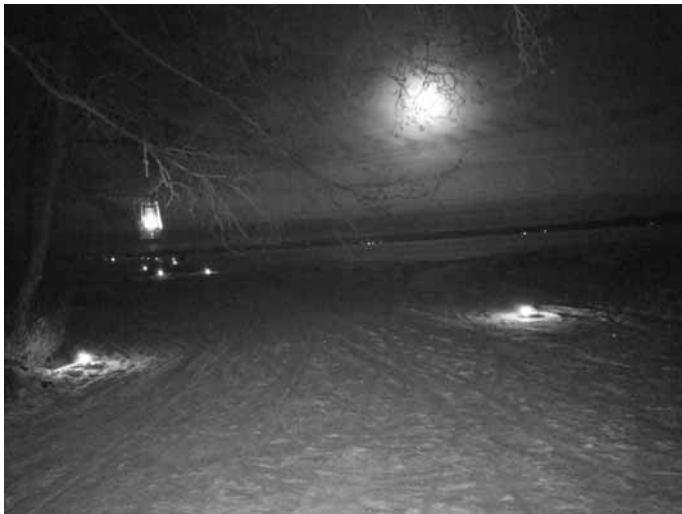
Näkymä öiselle karhijärvelle puhdistamonrannasta.

Olosuhteiden salliessa sunnuntaina 2.4. pidetään Selkäsaaren keväistä ulkoilupäivää. Lähempänä ajankohtaa näemme onko olosuhteet tapahtumalle suotuisat vai joudutaanko keväinen tapahtuma perumaan. Muutamina lauhoina keväänä tapahtuman olemme joutuneet perumaan. Selkäsaaren kiertäjät toivottavat kaikille pitämään itsestään liikkumalla huolta ja nauttimaan liikunnan iloista. (Vesa-Pekka Kuusela)