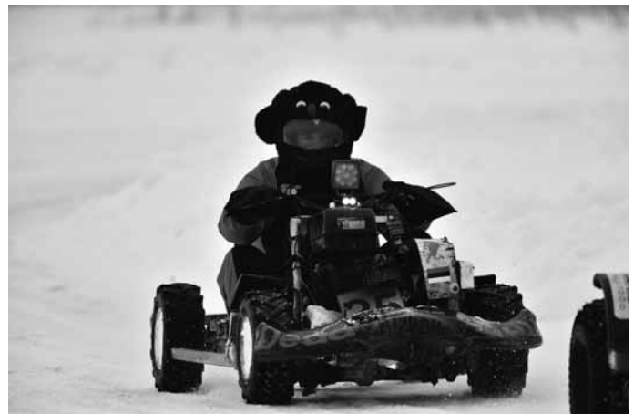
Nro:21 Votikmetsa Naised