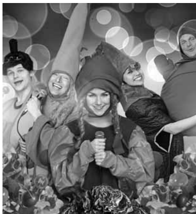
Mukulat kasvaa – Aikasoppa